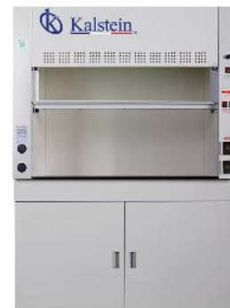
Campana extractora químico básico de acero recubierto de epoxi YR05813 // YR05816