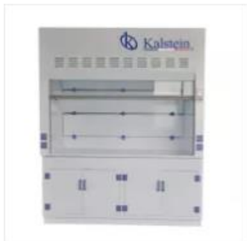
Campana Extractora de Humos PP