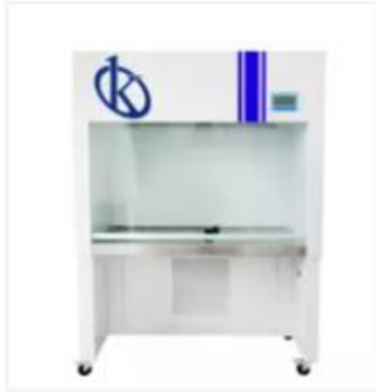
Banco de Limpieza de Suministro