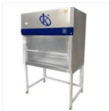
Cabina de seguridad biológica Cla