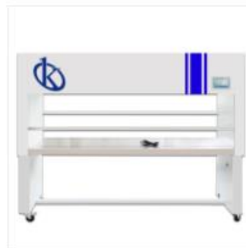
Cabina de Flujo Laminar YR05743