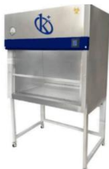
Cabina de seguridad biológica Clase II A2 YR0090B (SS) // YR0090E (SS)