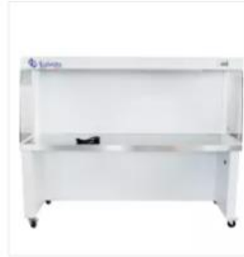
Cabina de Flujo Laminar de Sumir