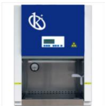
Cabina de bioseguridad Clase II A2