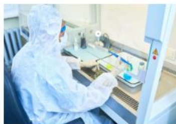
¿Cómo funciona una campana de extracción?