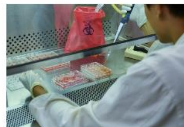
¿Cómo funciona una campana de flujo laminar?