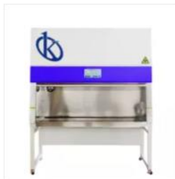
Cabina de Seguridad Biológica YR