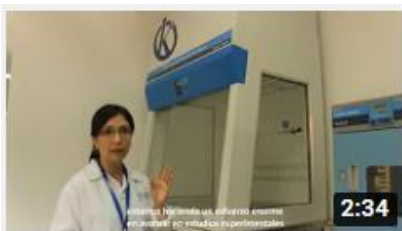
Kalstein France - Jacinto Convit Foundation / Allianc...