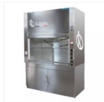
Campana extractora de laboratorio