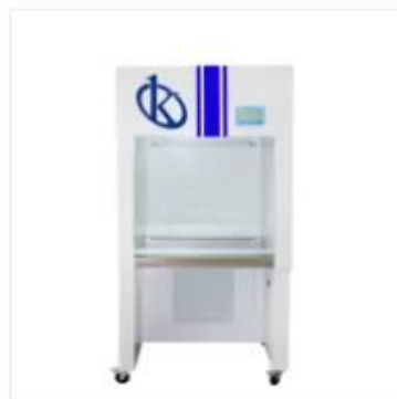
Cabina de Flujo Laminar YR05744