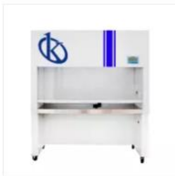
Cabina de Flujo Laminar YR05746