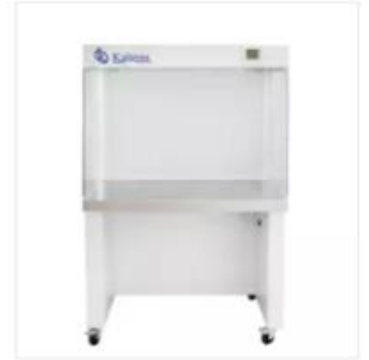
Cabina de Flujo Laminar con Sumi