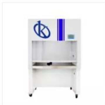
Cabina de flujo laminar YR05745