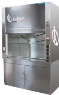
Campana extractora de laboratorio de acero inoxidable YR05823 // YR05825