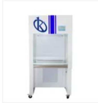
Cabina de Flujo Laminar YR05732