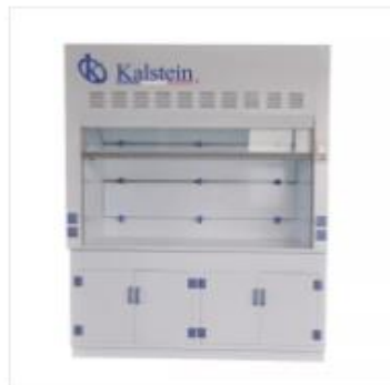
Laboratorio Ventilación Limpieza S