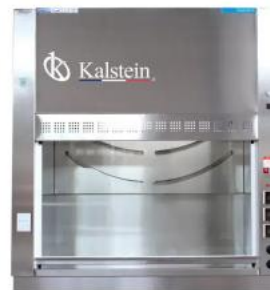
Vitrina de humos Equipo de laboratorio de hospital YR05820 // YR05822