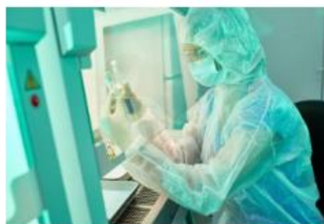
Campanas de laboratorio: Diferencias