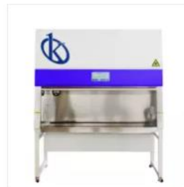
Cabina de Seguridad Biológica 10C