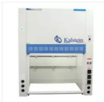
Campana Extractora de Sobremes