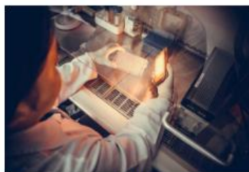
Campanas de flujo laminar